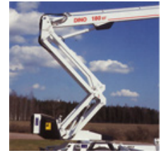
Schwenkbarer Arbeitskorb für exakte Arbeitsposition. Überfahren verschiedener Hindernisse bis 2,5 m durch vertikal bedienbares Scherengelenk.