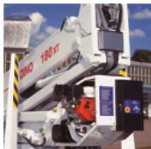
Die Bühne kann mit einem optionalen Motor ausgerüstet werden (Honda Benzin oder Hatz Diesel).